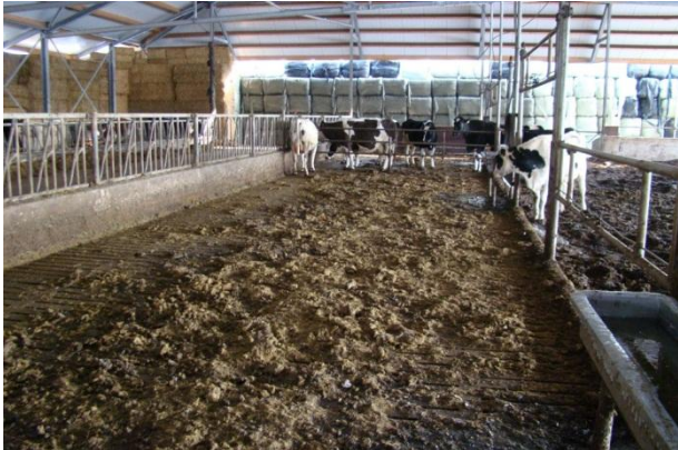
Bevroren mest op de roosters.

weinig mogelijk over de roosters te laten lopen. De koeien lopen nu via de vrijloopbodem naar de wachtruimte i.p.v. via de roosters.