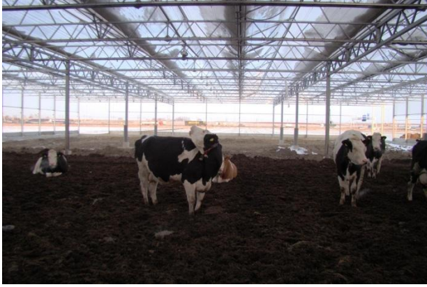
De noordoostkant van de stal is door de aanbouw volledig open.

De temperatuur in de stal is gemiddeld zo'n 5 graden warmer als buiten. Zeker als overdag de zon schijnt is het prima vertoeven in de stal. De zijwanden (computergestuurd) zitten op dit moment al zo'n anderhalve week dicht (gaan dicht als het in de stal 0 graden is).