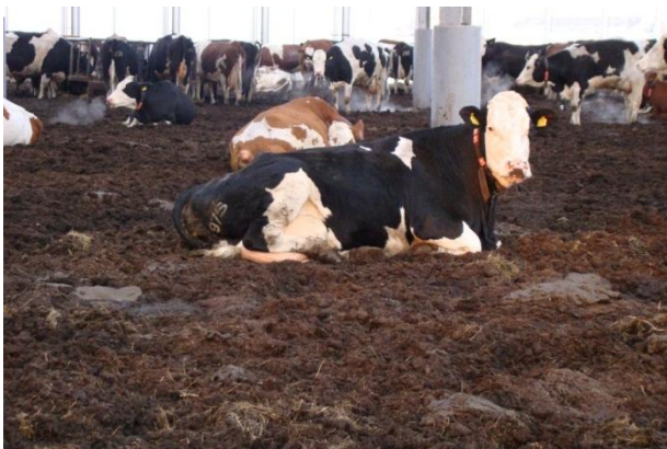
Bodem wordt droger door de vorst en lage luchtvochtigheid.

Marc Havermans ervaart in zijn vrijloopstal met compost geen problemen, en hij heeft dan ook geen speciale maatregelen genomen. "De bodem wordt eigenlijk steeds mooier en droger, ook al is het door de kou iets harder geworden." Wel blijft Marc elke week dezelfde hoeveelheid compost bij strooien die hij gewend is. Hij doet dit omdat hij verwacht dat de bodem met de dooi weer natter gaat worden, dus dat wil hij op deze manier voorkomen door alvast voldoende droog materiaal toe te voegen. De bodem is nu mooi droog, maar het is de vraag of het vocht daadwerkelijk verdampt is, of nog bevroren onderin de bodem zit opgeslagen. Verder freest hij de bodem dagelijks zoals gebruikelijk. Langs de randen is de toplaag wel wat hard, maar dat wordt met het dagelijkse frezen weer losser.