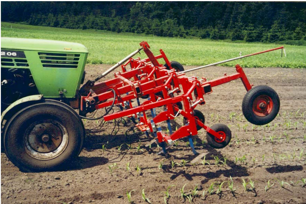
Frontschoffel plus torsiewieder