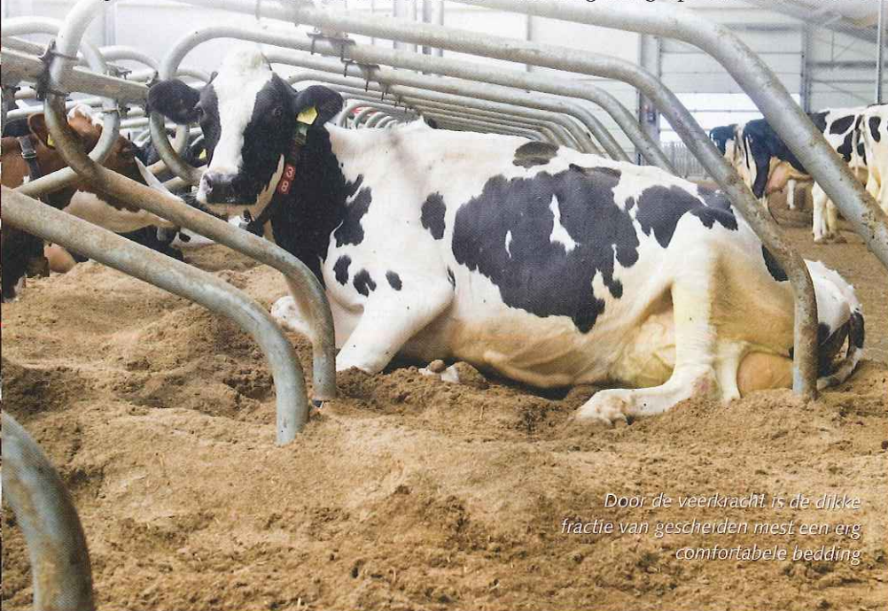
Door de veerkracht is de dikke fractie van gescheiden mest een erg comfortabele bedding

Beide deskundigen zijn ondanks positieve ervaringen in de praktijk nog voorzichtig. 'Op dit moment adviseer ik gescheiden mest in de boxen nog niet blind, omdat er nog te weinig onderzoeksresultaten zijn. De risico's zijn gewoon groot', stelt Oudman. Feiken sluit zich daar graag bij aan: 'Ik zou veehouders willen adviseren de resultaten van de onderzoeken af te wachten. Mocht een veehouder er toch mee willen starten, dan zou ik niet direct een mestscheider aanschaffen, maar eerst proberen door de loonwerker wat mest te laten scheiden.'