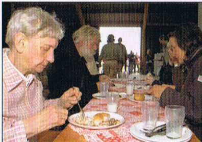
Smikkelen van Fries Roodbontvlees, bereid door Slagerij Jellesma in Sint Nyk.