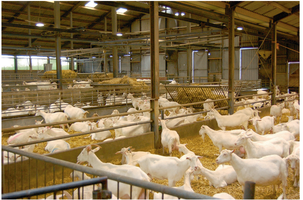
De organische stof in geitenmest en zeker het effectieve deel hiervan wordt niet of onvoldoende gewaardeerd door een groot deel van de Nederlandse akker- en tuinbouw.

Een belangrijk gevolg van het tekort aan vaste mest is dat op de meeste percelen het organisch stof gehalte in de bodem daalt. De kwaliteit van de bodem wordt daardoor langzaam maar gestaag minder. Als gevolg van het dalen van het humusgehalte daalt ook het waterbindend vermogen. Ook is humus in