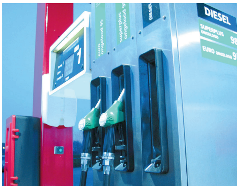
In de landelijke bladen staat ongeveer elke dag dat de olieprijsen weer een nieuw record hebben bereikt.