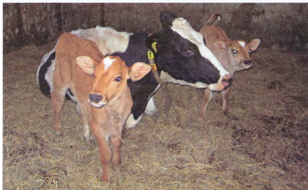
Maatschap Van Zelderen werkt hard om de gemiddelde leeftijd van de veestapel door het fokbeleid op te krikken. „We zitten nu op zes jaar, maar werken naar zeven à acht toe.”