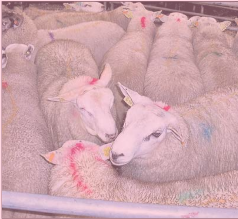
Op de markt moeten schapen en koeien worden verhandeld.